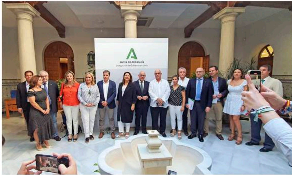
La consejera de Agricultura, Carmen Crespo, en la presentación del Aforo aceitero en Jaén.

Respecto a Jaén, la provincia mayor productora del país y que aporta casi el 40% del caldo andaluz de esta campa, las estimaciones del aforo oficial son de producir 1.012.000 toneladas de aceituna de almazara, que con un rendimiento medio estimado del 21%, arroja una producción de 215.000 toneladas de aceite. Se trata de un 19% más sobre las 179.864 tm y un 52,8% menos sobre la media de las últimas 5 campañas. Como ocurría en Andalucía, también para Jaén ésta sería la tercera peor campaña