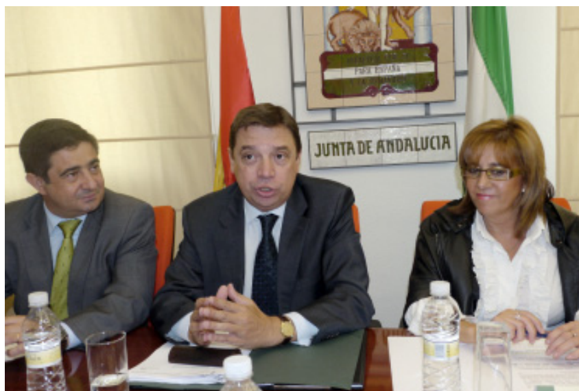
Luis Planas, en el centro, durante la presentación de los datos del Aforo oficial en Jaén, con el presidente de la Diputación y la delegada del Gobierno en la provincia.

► La debilidad del cultivo, debida a las tres últimas campañas récords de producción, junto a la escasez de lluvia se citan por el consejero Luis Planas como las principales causas de esta campaña de ruina que está a punto de iniciarse.